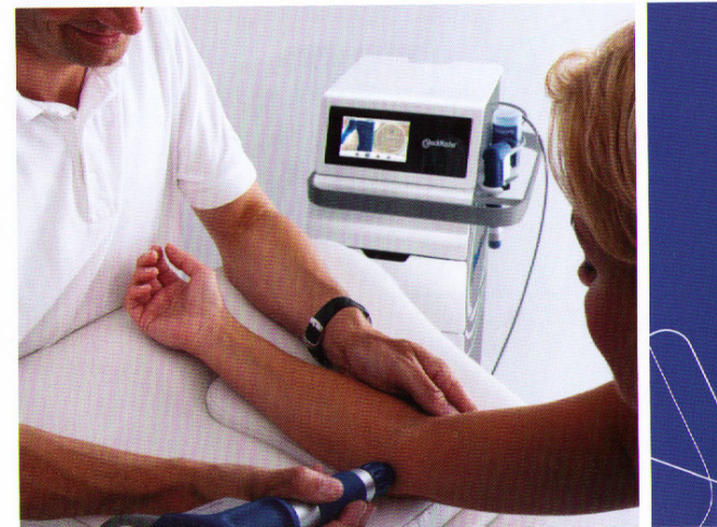
Behandlung des Golferellenbogens

Die Behandlung dauert zwischen 5 und 10 Minuten; ein Behandlungserfolg ist oft schon nach ein bis zwei Anwendungen spürbar. Die wieder gewonnene Schmerz- und Bewegungsfreiheit gibt Ihnen ein Stück Lebensqualität zurück!