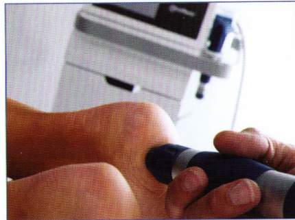
Behandlung des Fersensporns